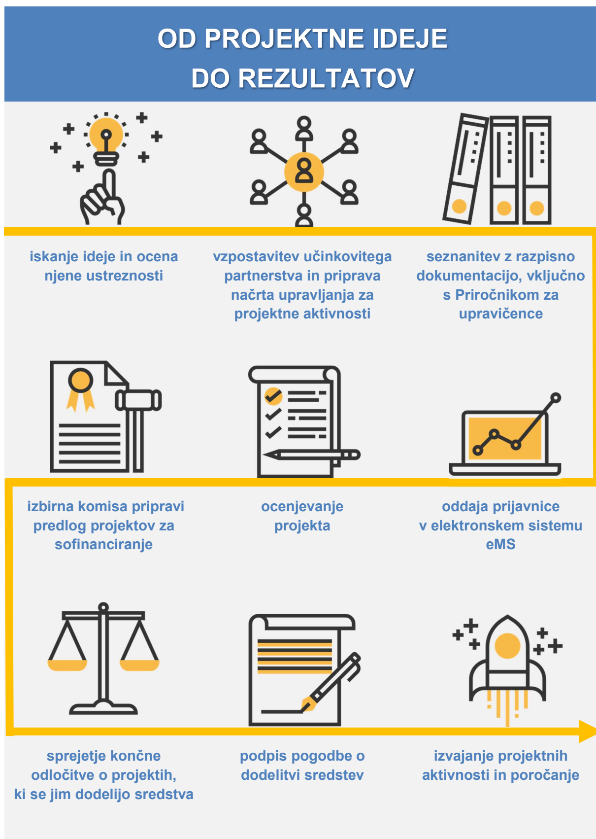
Slika 7: Od projektne ideje do rezultatov