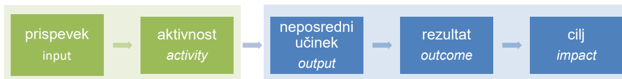
Slika 2: K rezultatom usmerjeno upravljanje

rdeča linija, ki ponazarja pričakovane vzročno-posledične povezave med različnimi elementi (Slika 2).