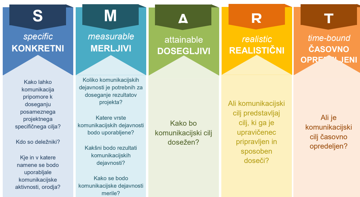
Slika 6: Pristop SMART

Opredelitev komunikacijskih ciljev projekta zgolj z "dvigovanjem ozaveščenosti" in/ali "obveščanjem o aktivnostih in rezultatih" ne zadošča.