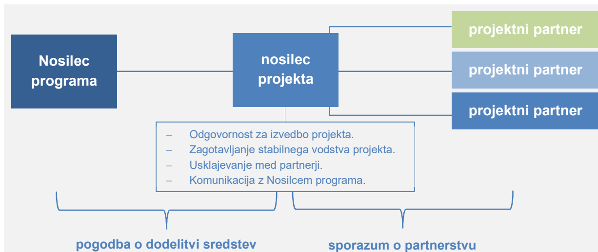
Slika 5: Struktura vodenja projekta

Slika 5 prikazuje odnose med Nosilcem programa, nosilcem projekta in projektnimi partnerji.