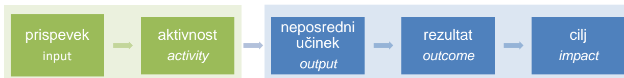
Slika 2: K rezultatom usmerjeno upravljanje

Upravljanje finančnih mehanizmov in programov sloni na metodi RBM. Bistvo metode je njena osredotočenost na doseganje ciljev in rezultatov in ne na aktivnosti in postopke. Pri tem je torej ključna postavitev jasnih ciljev ter določitev ustreznih kazalnikov za merjenje napredka v smeri njihovega uresničevanja. Temeljni element RBM metode je »veriga dosežkov«, nekakšna rdeča linija, ki ponazarja pričakovane vzročno-posledične povezave med različnimi elementi (Slika 2).